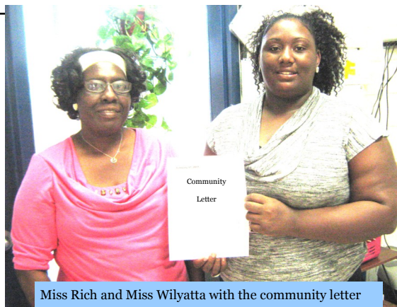
Miss Rich and Miss Wilyatta with the community letter

It's the Unity in community that makes a neighborhood strong.