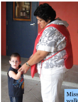
Miss Caridad y Amigo walking side-by-side

"No camines delante de mí porque no puede seguir. No camines detrás de mí, porque no puede conducir. Sólo hay que pasar a mi lado y sé mi amigo." Albert Camus