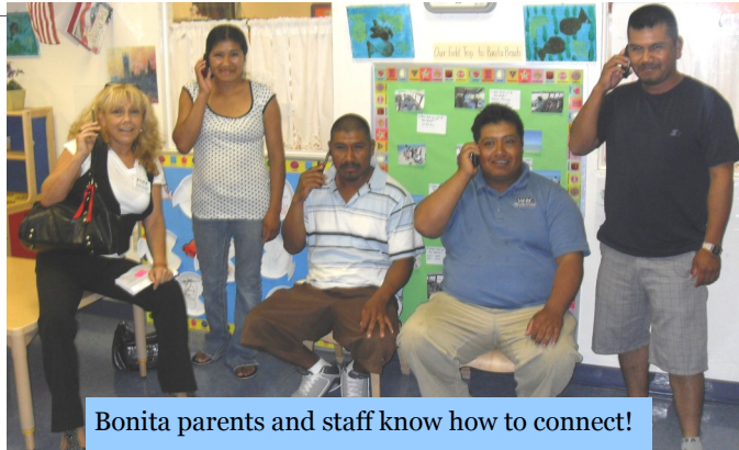
Bonita parents and staff know how to connect!

What system do you have in place at your center? Can you make it better?