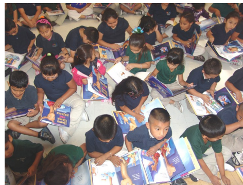
At RCMA reading is fundamental

"No camines delante de mí porque no puede seguir. No camines detrás de mí, porque no puede conducir. Sólo hay que pasar a mi lado y sé mi amigo." Albert Camus