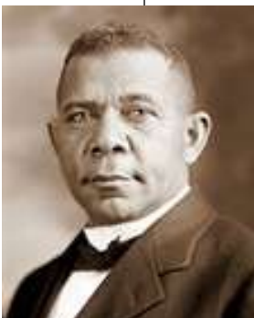
I shall allow no man to belittle my soul by making me hate him. Booker T. Washington

Few things can help an individual more than to place responsibility on him, and to let him know that you trust him. Booker T. Washington