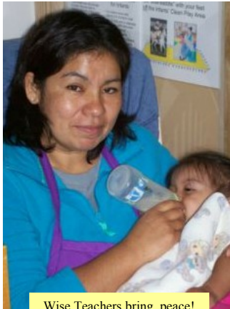
Wise Teachers bring peace!