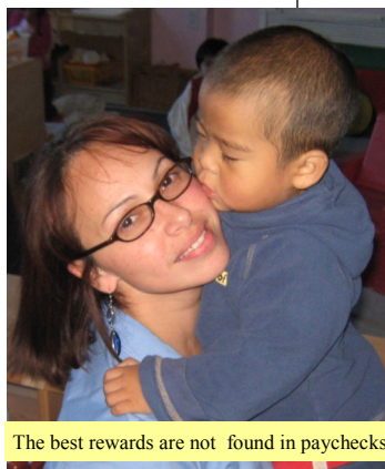
The best rewards are not found in paychecks

¿Cuándo fue la última vez que pasó un tiempo trabajando con un profesor? Por favor, únense a mí en mi decisión de reconocer a los maestros de RCMA a través de nuestro tiempo, palabras, obras y acciones. Vamos a agradecer a los maestros por su contribución desinteresada y amorosa que le dan a nuestro mundo. Feliz Año Nuevo!