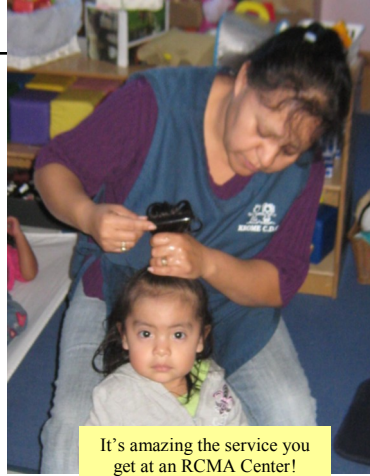
It's amazing the service you get at an RCMA Center!

When was the last time you spent time working alongside a teacher? Please join me in my resolution to recognize RCMA teachers through our time, words, deeds and actions. Let's thank Teachers for their selfless, loving contributions that they give to our world. Happy New Year!!!