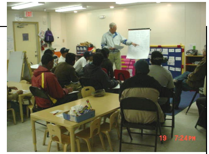
19 7:24 PM

“ We are allowed to make mistakes,” he says to them. The parents are reminded that with practice, practice and more practice they will have the confidence and courage to go out into their world speaking English.