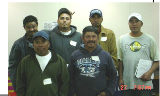
27 7:37 PM

“ Se nos permite cometer errores,” les dice a ellos. Los padres deben recordar que con práctica, práctica y más práctica, tendrán la confianza y la valentía de salir a su mundo y hablar inglés.