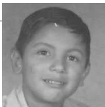
Dr. under construction