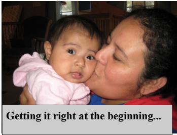
Getting it right at the beginning...