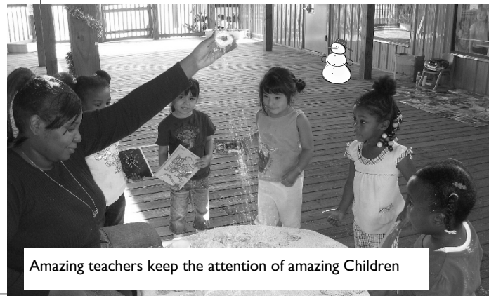
Amazing teachers keep the attention of amazing Children