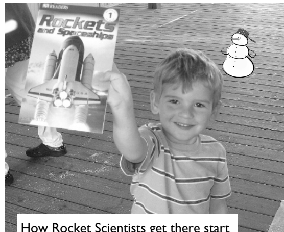
How Rocket Scientists get there start