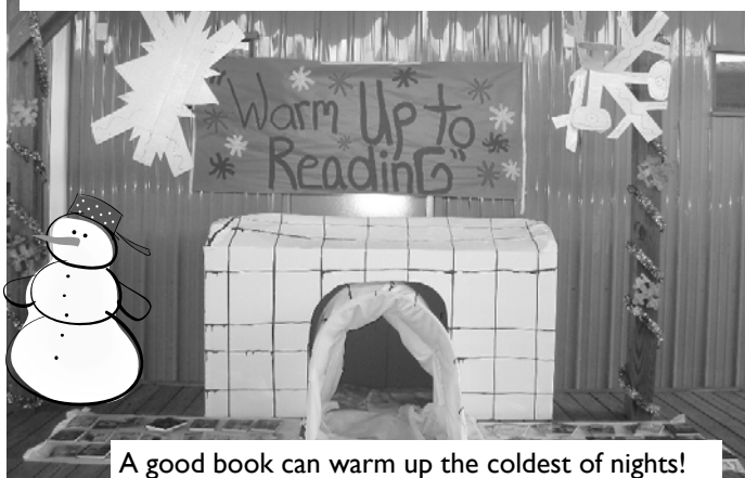
A good book can warm up the coldest of nights!

It's amazing how writers can arrange those 26 letters in ways that can trigger a smile!