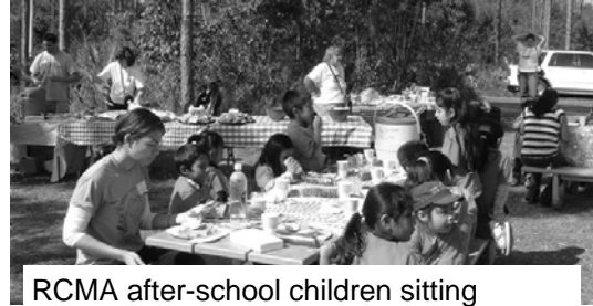
RCMA after-school children sitting down to lunch Everglades National Park