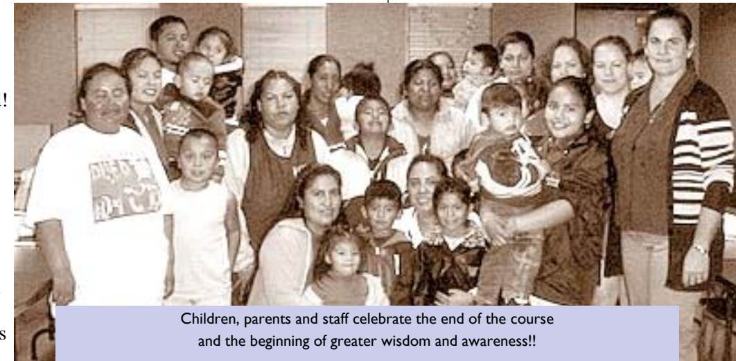
Children, parents and staff celebrate the end of the course and the beginning of greater wisdom and awareness!!

Ahora, el Centro de Pre Rollason va tener la segunda serie de clases para padres en enero de 2009. Quince ya los adres están interesados en inscribirse! Las clases van a ser en English.