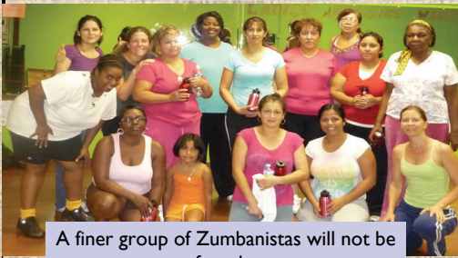
A finer group of Zumbanistas will not be found...