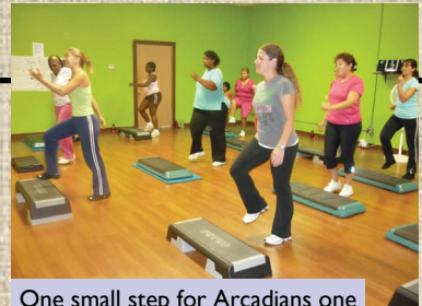
One small step for Arcadians one giant step for good health