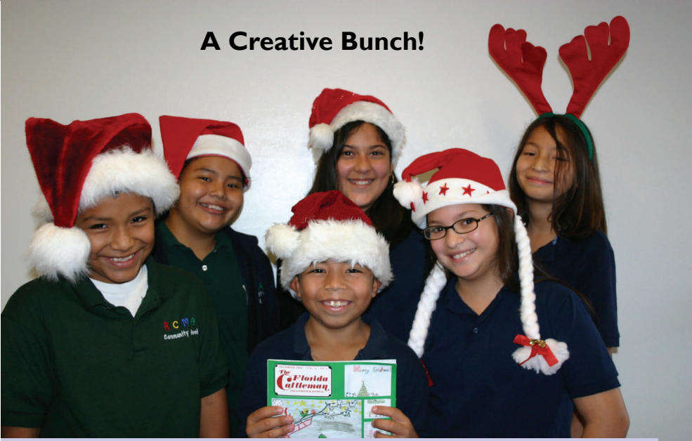
A Creative Bunch!

If you have a subscription to the The Florida Cattlemen magazine then you are in for a treat. A treat because on the cover, of this month's issue is the artwork of a creative group of RCMA students.