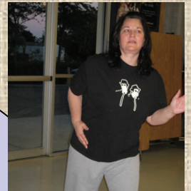
AC Gloria amazes everyone with her memorable robot dance.

Gracias a los fondos donados por ARRA, la gente de Arcadia e Immokalee pueden bailar por su salud.. Gracias gente de Arcadia e Immokalee, por su buen ejemplo.