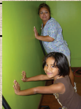
Thanks to brave volunteers none of the walls in Arcadia fell down