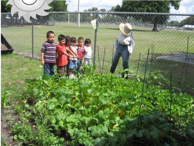
Wimauma agronomists checking out their crops