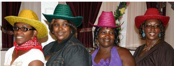
“Don’t Fence Us In! RCMA Achievers

“No importa cómo poco a poco ir siempre como usted no se detienen” Confucio