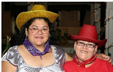
Cowgirls make good partners