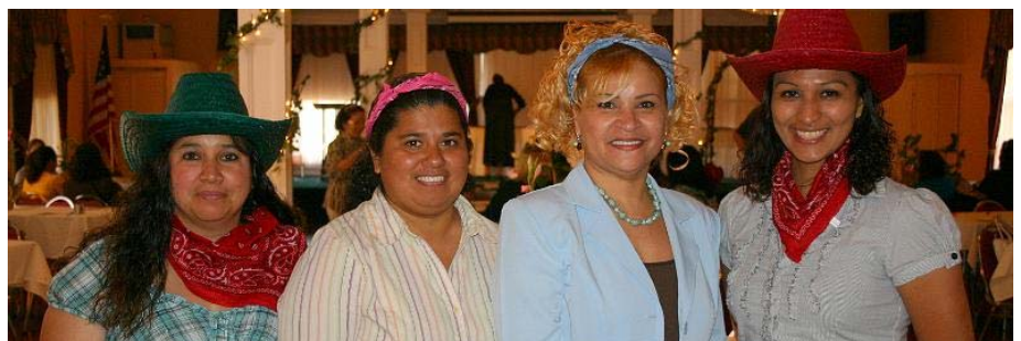
On the Western Side of things there’s a lot of wide open spaces