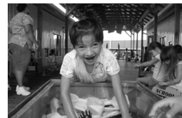
Smiles come easily at the water table!

Opening Doors to Opportunity is not just a good idea... It's Our Mission! It's What We Value!