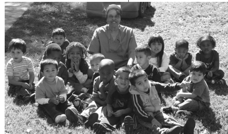
Sometimes it feels good just to sit and ponder possibilities!