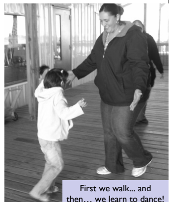
First we walk... and then... we learn to dance!