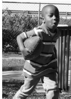
New Hope kids are mobile and agile in the classroom and on the field

We are at our very best, and we are happiest, when we are fully engaged in work we enjoy on the journey toward the goal we've established for ourselves. It makes everything else in life so wonderful, so worthwhile. E. Nightingale