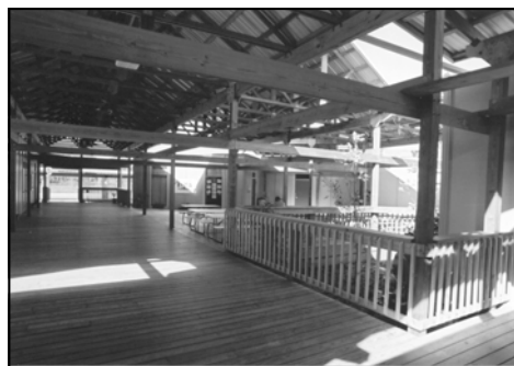
Central Plaza of the Wimauma Academy

Construction is under way to finish the third floor and add new sixth-grade classrooms. During the 2006-07 school year, ICS will have its first sixth-grade class. This wonderful development was made possible thanks to a $500,000 grant from the Naples Children and Education Foundation, and a year of hard work by RCMA to raise a matching $500,000.