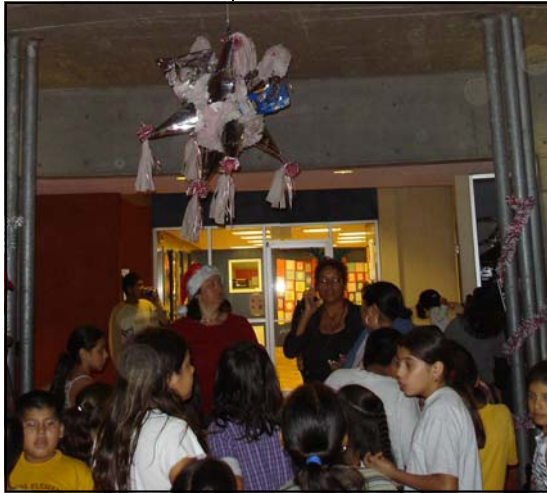
The Piñata and the litany of the Holy Pilgrims/ La Piñata y la letanía de los Santos Peregrinos

In some countries of Latin American Christmas festivities begin with Las Posadas , nine consecutive days of candlelight processions and lively parties starting December 16. In villages and urban neighborhoods throughout Mexico people gather each afternoon to reenact the holy family's quest for lodging in Bethlehem. The procession is headed by a small María, often perched on a live donkey, led by a equally tiny San José. The parade of Santos Peregrinos (Holy Pilgrims) stops at a designated house to sing a traditional litany by which the Holy Family requests shelter for the night and those waiting behind the closed door turn them away. They proceed to a second home where the scene is repeated. At the third stop the pilgrims are told that while there is no room in the posada (inn), they are welcome to take refuge in the stable. The doors are flung open and all are invited to enter. Merry making that follows, above all the chance to engage in the ruthless smashing of piñatas and a mad scramble for the shower of fruits, sugar cane, peanuts and candies released from within. Immokalee Area celebrated a Posada in December 17th.